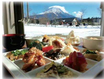
あさぎりフードパーク