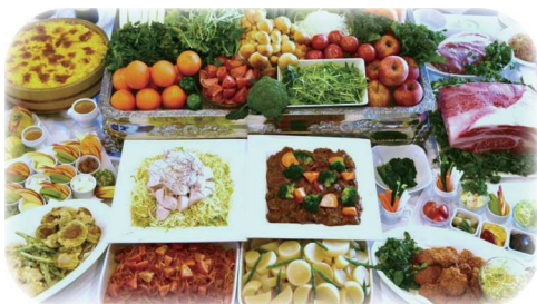
あさぎりフードパーク