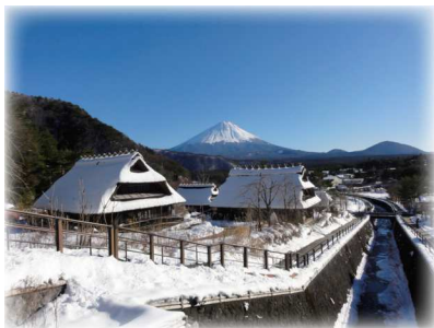
西湖いやしの里根場

座間市==圏央道==東名高速==休憩/中井PA==新東名高速== (8:00) (8:40~8:55) 参拝/富士山本宮浅間大社==昼食・買物/あさぎりフードパーク ブッフェレストランふじさん (10:00~11:00) (11:40~13:10) ==見学/富士花鳥園==散策・買物/西湖いやしの里根場==中央道== (13:15~14:00) (14:35~15:15) 休憩/談合坂SA==圏央道==座間市 (16:15~16:30) (17:30)