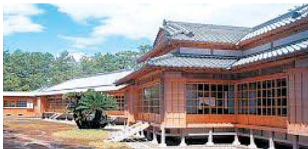
沼津御用邸／ハマナデシコ、浜木綿、スカシユリなどが見頃です。

A～Dよりお一つお選びいただけるチケット付き。内容の変更がある場合がございます。ご了承ください。