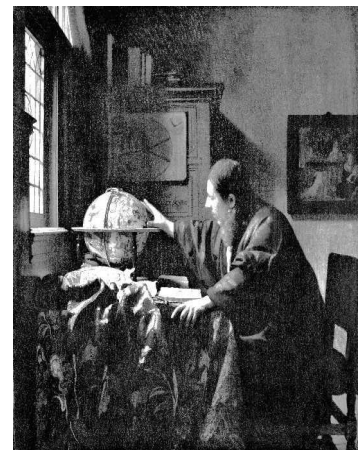
ヨハネス・フェルメール《天文学者》1668年