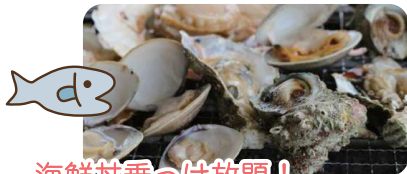
海鮮丼乗っけ放題! 貝焼き食べ放題! ソフトドリンク飲み放題!