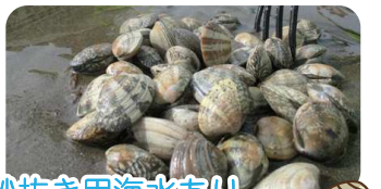
砂抜き用海水あり 無料更衣室完備