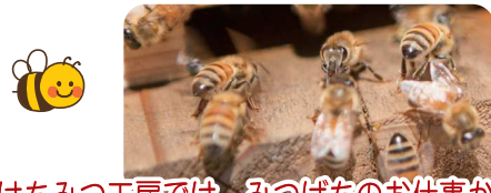
はちみつ工房では、みつばちのお仕事からはちみつができるまでを 実際に見ることができます。