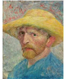
フィンセント・ファン・ゴッホ 《自画像》 1887年 City of Detroit Purchase