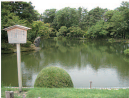
金沢といえば『兼六園』ですね