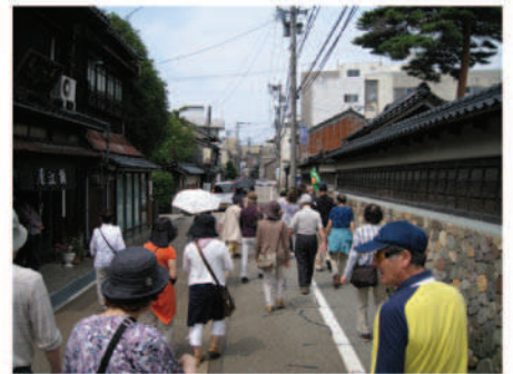
昔ながらの街並みを楽しめます