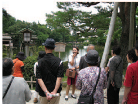
ガイドさんの説明を熱心に聞きます