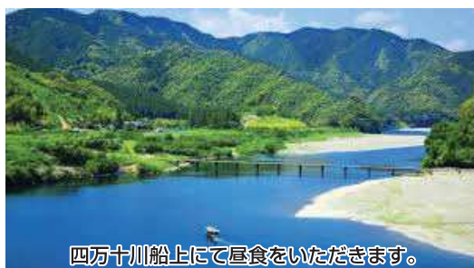
四万十川船上にて昼食をいただきます。

ホテルにて朝食後、出発までご自由にお楽しみください。 とさでん1日乗車券(高知市内のみ)をご利用いただけます。 土佐御苑(チェックアウト10:00) == 見学/桂浜 == お買物/かつお船 == <15:00集合> <15:30～16:10> <16:20～16:50> 高知竜馬空港⇒⇒東京国際空港 == 座間市 <18:15発 ANA570便 19:40着> <22:00頃>