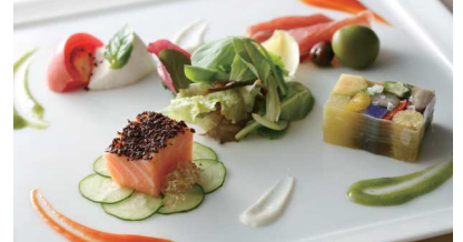
※料理写真はイメージです

ガーデンタワー最上階40階からの絶景と、オープンキッチンから供されるスペシャリテの備長炭グリル料理。こだわりの特撰素材のうまみを最大限に活かした料理の数々を、ホテルならではのゆったりとした時間と共に楽しみください。