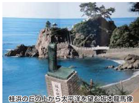
桂浜の丘の上から太平洋を望む坂本龍馬像