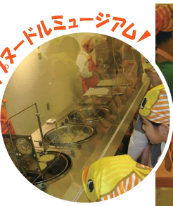
↑カップヌードルミュージアム↑

お天気にも恵まれ、気持ちの良い秋空の中、いざ横浜へ! 小さいお子様から、ご年配の方まで幅広い方々が楽しめたツアーでした。 近場でも、知らない場所や見たことのない景色が新鮮でした。