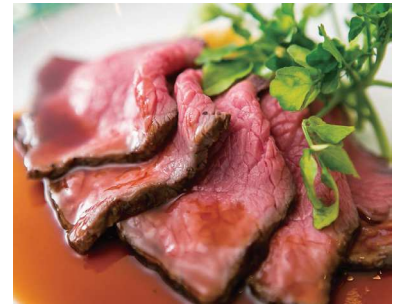
『低温熟成ローストビーフ』食べ放題! 毎日開催しております。

有効期限 5月31日(日)まで クリスマス期間・年末年始及び特別営業日は利用除外日となります。 利用施設 クルーズ・クルーズYOKOHAMA (JR横浜駅東口直結 徒歩3分 他) 営業時間 11:00~14:30(LO14:00) ※時間無制限 価格 ランチbuffe券 1,800円 (通常価格 2,970円) 60歳以上 1,600円 (通常価格 2,640円) ※土日祝日にご利用の場合は、差額440円を 現地にてお支払いください。 ※60歳以上の方は当日身分証明書を確認させていただきます。 枚数 全200枚(1会員4枚まで) 交換期間 12月9日(月)~12月13日(金) 予約 ・予約制となります。 ・個室の予約は6名様より(個室料金別途あり) ・土日祝のご予約は1か月前より受付開始 (平日は随時予約可能) ・他の割引、ご優待、クーポンとの併用不可