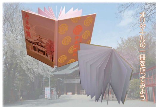
オリジナルの1冊を作ってみよう

御朱印帳の1ページ目は鈴鹿明神社の御朱印をいただきます。 作成後、宮司に鈴鹿明神社の歴史や境内を案内していただきます。