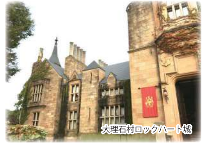
大理石村ロックハート城