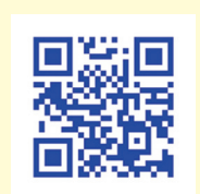
↑ホームページはこちら