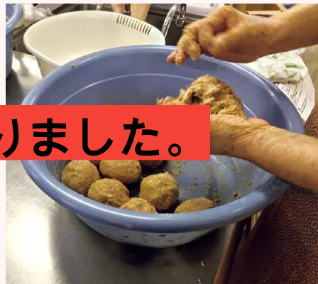
※昨年の講座の様子

キャンセル料 3日前から1,000円かかります。(参加費1,800円の返金はいたしません。)