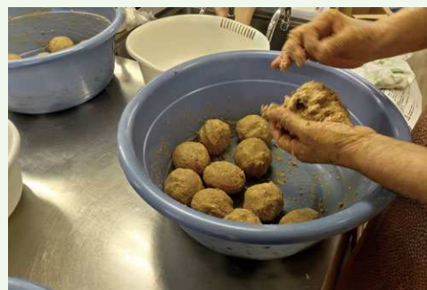
※昨年の講座の様子

キャンセル料 3日前から1,000円かかります。(参加費1,800円の返金はいたしません。)