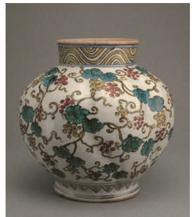
色絵 葡萄文 瓜形壺 伊万里(古九谷様式) 江戸時代(17世紀中期) 高21.2cm 戸栗美術館所蔵